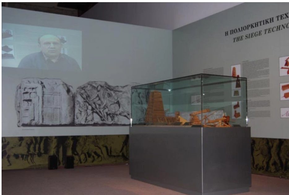
Έκθεση Αρχαίας Ελληνικής Τεχνολογίας στη Λεμεσό Κύπρου, στον εκθεσιακό χώρο του Ιδρύματος Λαλίτη.

Μια μοναδική έκθεση με τις σημαντικότερες εφευρέσεις των αρχαίων Ελλήνων (από το «ρομπότ – υπηρέτρια» του Φίλωνος μέχρι τον «κινηματογράφο» του Ήρωνος και από το αυτόματο ωρολόγιο του Κτησιβίου μέχρι τον αναλογικό υπολογιστή των Αντικυθήρων) παρουσιάζει το Μουσείο Αρχαίας Ελληνικής Τεχνολογίας του Κώστα Κοτσανά (που βρίσκεται στο Κατάκολο) www.kotsanas.com στον 3ο όροφο του the Mall Athens (στο Μαρούσι) καθημερινά 12.00 με 21.00 μέχρι τις 30 Ιουνίου 2013 με ελεύθερη είσοδο και δωρεάν ξενάγηση για το κοινό.