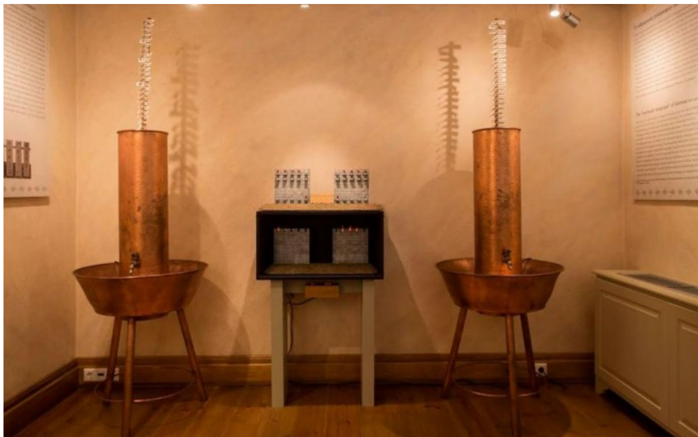
Ο υδραυλικός τηλέγραφος του Αινεία

Ειδήσεις Επιστήμη - Τεχνολογία Έρευνα Κοινωνία Jan 15, 2017 - 12:00 pm