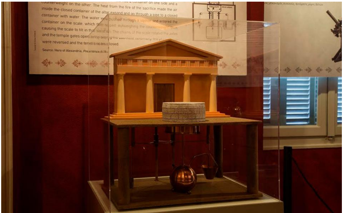
Η παρουσίαση του αυτόματου ανοίγματος θυρών ναού ύστερα από θυσία στον βωμό του, μια άγνωστη εφαρμογή της αρχαίας ελληνικής τεχνολογίας.