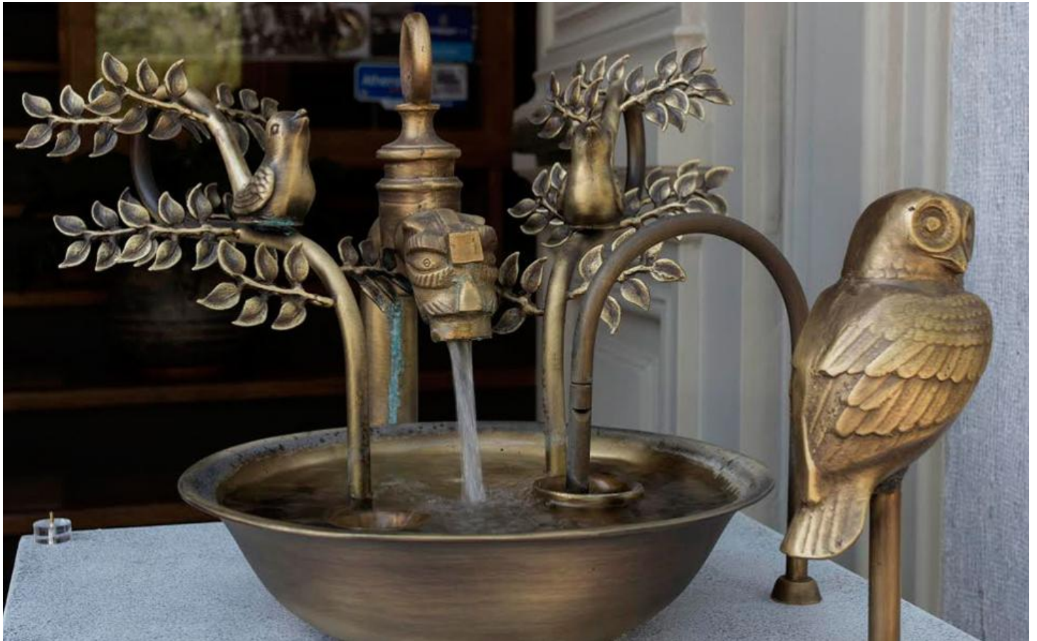
Το υδραυλικό αυτόματο των «φθεγγομένων ορνέων» και της «επιστραφείσης γλαυκός» του Φίλωνος.