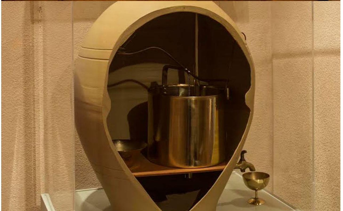
Το αυτόματο σπονδείο με κερματοδέκτη (επάνω) και κάτω η μηχανή παραγωγής περικοχλίων του Ηρωνος (1ος αιώνας μ.Χ).